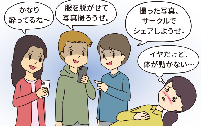
裸の写真を撮られてしまった・・・